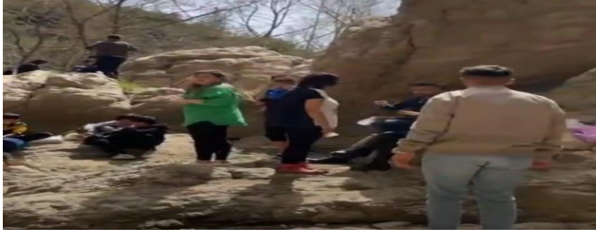
ÖĞRENCİLERLE DOĞA YÜRÜYÜŞÜ