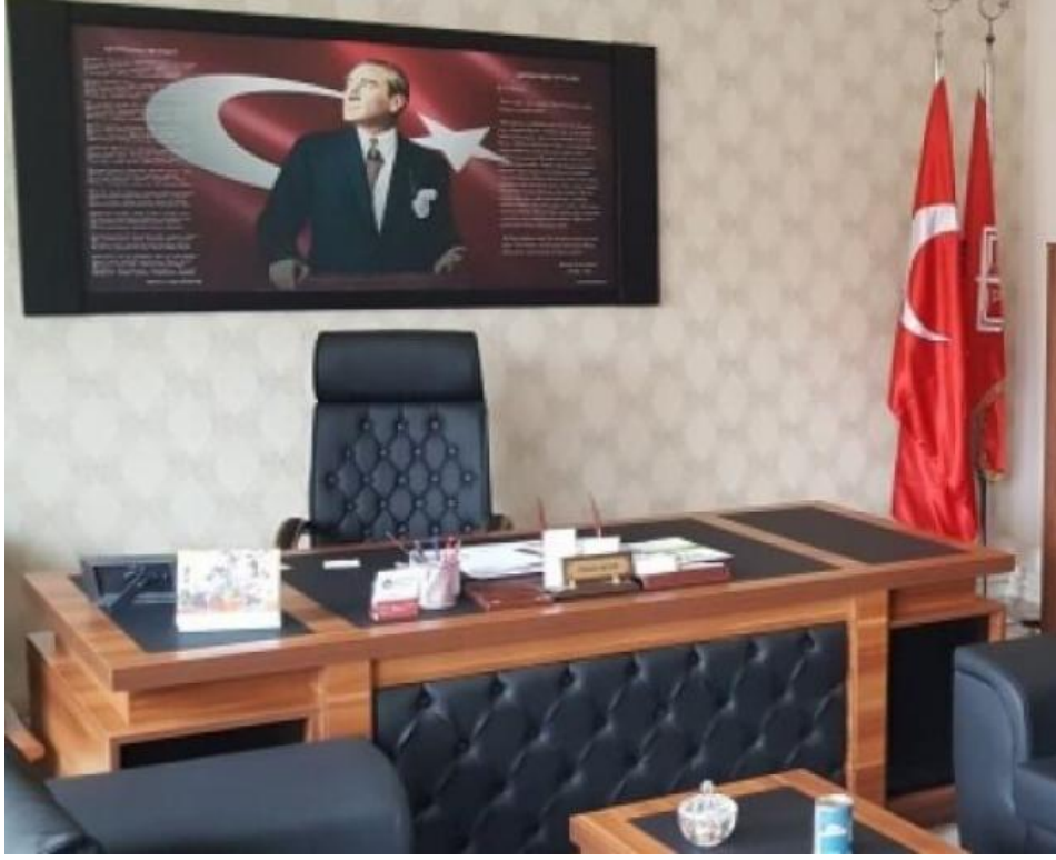
Müdür Beyin Resmi